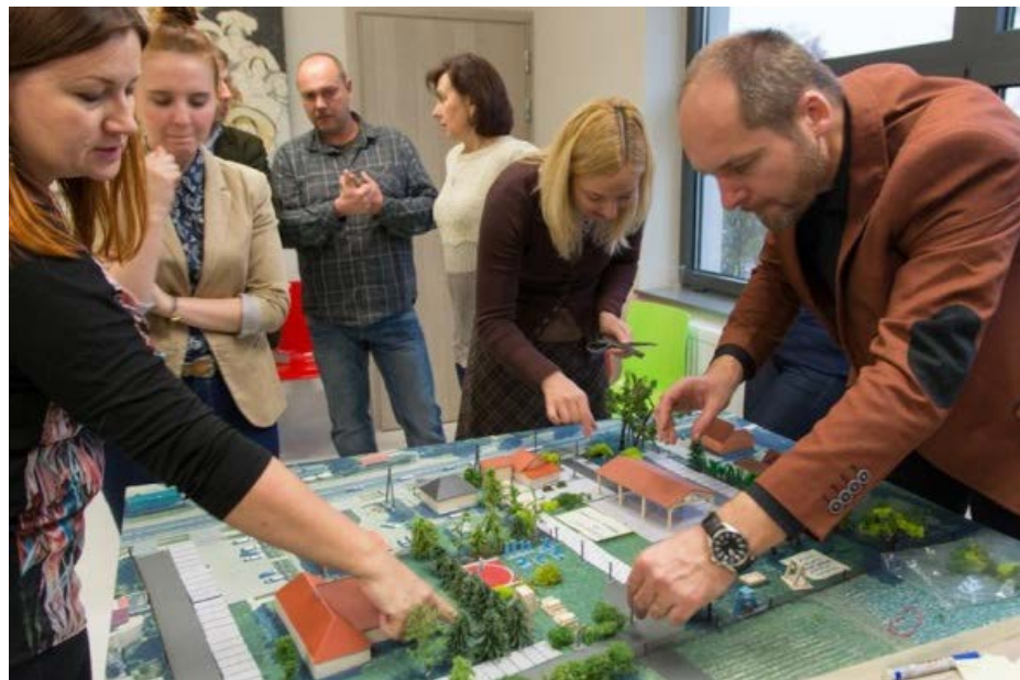
Проектування облаштування торгово- розважального майданчика в Michałowicach(XI 2015)