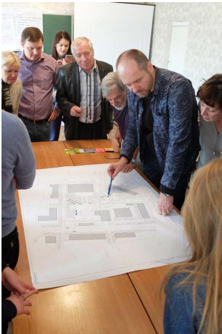
Проектування змін на Майдані Незалежності в Маріуполі(X 2015)